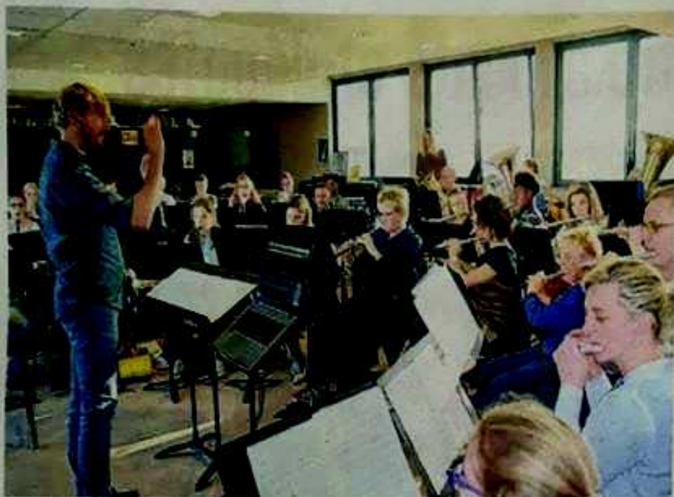
Les 20 minutes de ciné-concert imposent une préparation précise.